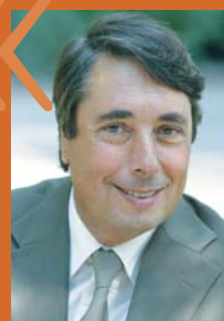
Michel Destot, président du GART

La voiture partagée a toute sa place dans un service public de mobilité durable. Son usage vient alors en complément des transports collectifs, de la marche et du vélo. Cette définition commune est un outil au service des autorités organisatrices pour définir ce nouveau service.