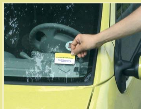
Un service pratique, fiable et abordable