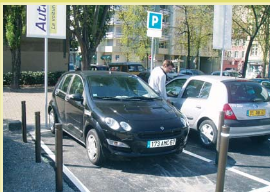
Un service facile d'accès et respectueux de l'environnement